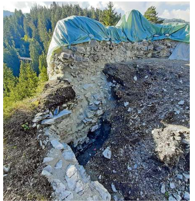
La ruina Lagenberg sil crest digl Uaul Casti ei restaurada migeivla-mein ed ha retschert in access.